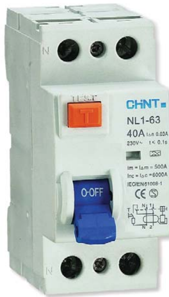
Rys. 3. Wyłącznik różnicowoprądowy NL1-63

Wyłączniki różnicowoprądowe z członem nadprądowym NB1L dostępne są w dwóch wersjach: jako zintegrowane wyłączniki tzw. kombinowane – dwupolowe, oraz wyłączniki z dodanym blokiem róż-