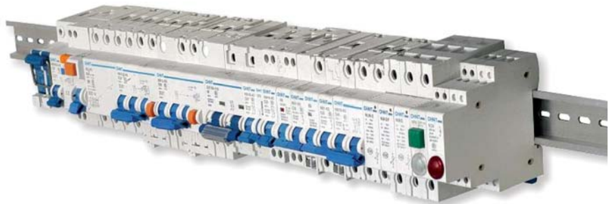
Rys. 1. Aparatura modułowa firmy Chint