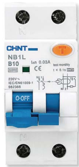
Rys. 4. Wyłącznik różnicowoprądowy NB1L

Wyłączniki NB1L są produkowane na prądy znamionowe I_n od 1 A do 25 A